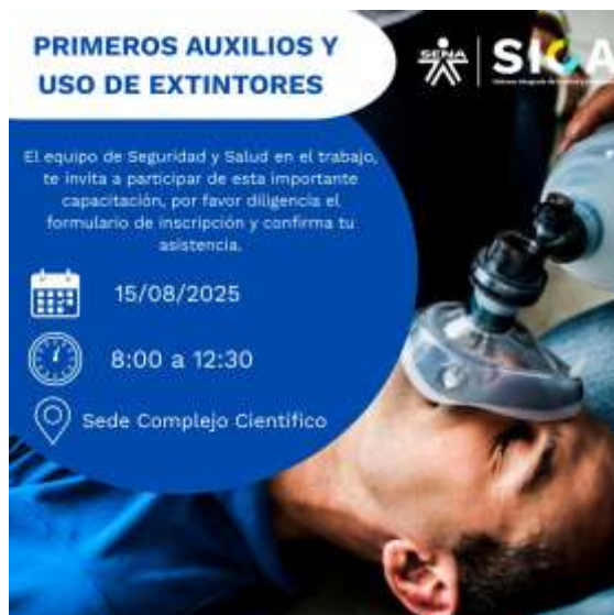
Imagen 1. Programación de la jornada

Se participa en jornada de capacitación sobre primeros auxilios y uso de extintores, adelanta por el grupo SIGA