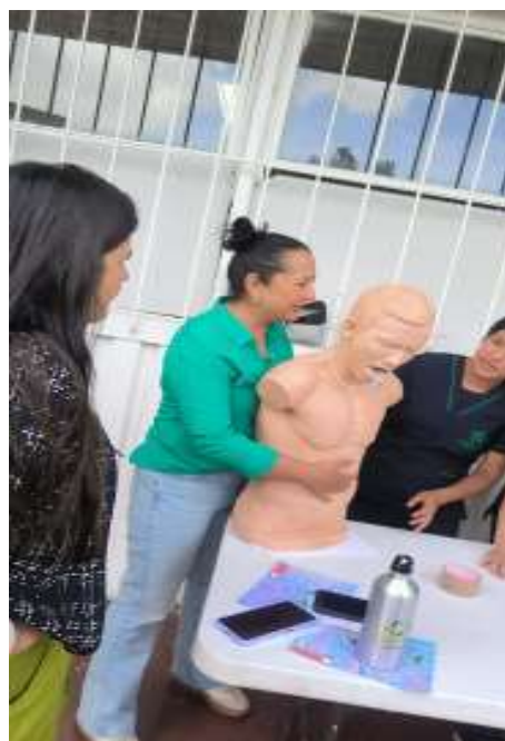
Imagen 1 al 5: Participación en cada una de las jornadas de capacitación